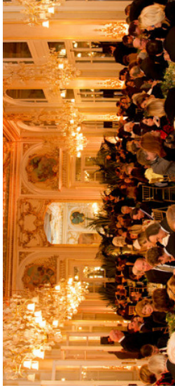
5 e dîner de gala annuel de la SAMO