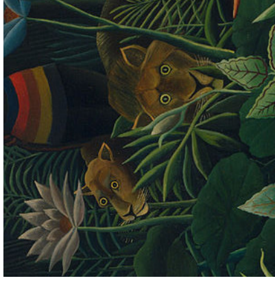
Henri Rousseau, fille Douanier (1844-1910). Le rêve (détail), 1910 Huile sur toile, 204,5 x 286,5 cm, New York, MoMA Autour de l'exposition du Douanier Rousseau

sur la notion d'archaïsme. L'archaïsme est ainsi le fil conducteur entre les œuvres de cette exposition. Les chefs-d'œuvre d'Henri Rousseau des collections des musées d'Orsay et de l'Orangerie (de La Charmeuse de Serpents à La Noce) sont confrontés aux toiles prêtées par les plus prestigieuses institutions internationales. Des œuvres de Seurat, Delaunay, Kandinsky ou Picasso mais aussi d'artistes méconnus permettent d'évoquer la richesse des liens qui se tissent autour du Douanier Rousseau, creuset d'une voie originale dans l'exploration de la modernité.