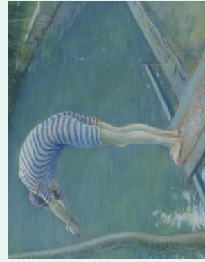
Gustave Caillebotte, Le Nageur , 1877. Pastel sur papier, 69 x 86,5 cm Paris, musée d'Orsay, RF-1946-34