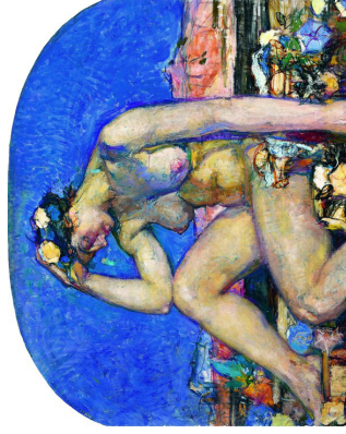
La Grèce, 1910 (huile sur toile), Adagp, Paris 2016. Studio Sibiéri Photographies et droits réservés.