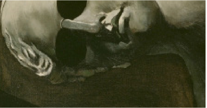
Giorgio de Chirico (1888-1978). - Portrait. (prénombré) de Guillaume Apollinaire, 1914. Paris. Musée National d'Art Moderne-Centre Pompidou