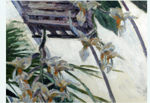
Gustave Caillebotte, Orchidées, 1893. Huile sur toile, 65,3 x 54 cm. Collection particulière.

Accès à tarif réduit pour les amis d'Orsay et un accompagnateur de 10h à 18h (17h30 dernière admission).